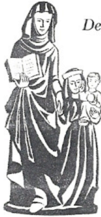
Ecole Sainte Anne